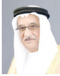
الشيخ محمد بن عبدالله آل خليفة

تنفيذ الخطط والمساعدات لمكافحة مرض نقص المناعة المكتسبة «الإيدز»، حيث تسير المملكة بخطى ثابتة نحو مواصلة التطور والازدهار في هذا الجانب بفضل الدعم والرعاية من جلالة الملك المعظم حفظه الله ورعاه وسمو