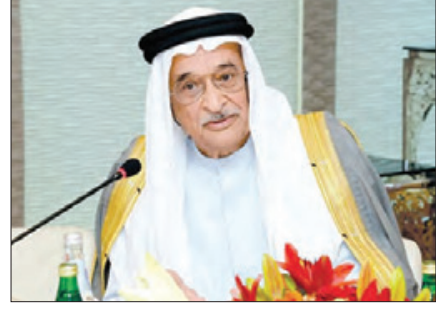
الشيخ محمد بن عبدالله