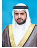
سمو الشيخ عيسى بن علي آل خليفة.

وتمن سمو الشيخ عيسى بن علي الجهود المخلصة التي يبذلها رئيس وأعضاء جمعية الكلمة الطيبة وجميع منتسبيها في خدمة العمل التطوعي والإنساني، وتحسين صورة البحرين حضارية مشرفة، مشيراً إلى أن منظمات المجتمع المدني تؤدي دوراً تكاملياً مع الحكومة في تلبية