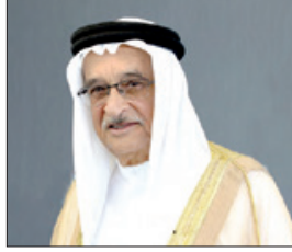
الشيخ محمد بن عبدالله

والرزمة الصحية المتمتع بها المريض. وأضاف: «يجب أن يكون لكل مريض بالطب الخاص سجل طبي ورقي والكتروني. يسجل فيه الطبيب بيانات المريض الشخصية والمرض. وفي حالة خضوع المريض لإجراء طبي أو جراحي يجب إرفاق نسخة من السجل الطبي الخاص به عن حالته متضمناً نتائج الفحوص والتحاليل اللازمة لإرفاقها بسجل المريض في المستشفى الحكومي.»