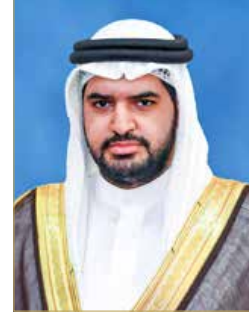
سمو الشيخ عيسى بن علي