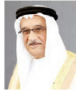
رئيس المجلس الأعلى للصحة.

الحكومية والجهات ذات الصلة بالطلب الخاص، والتحقق في أي مخالفة لأحكام هذا القرار ويرفع الفريق نتيجة التحقيق ورفقاً به مقترحاته إلى مجلس الأمناء لاتخاذ ما يلزم في هذا الشأن. وأشار القرار المنشور في الجريدة الرسمية إلى أن التحاق الأطباء الاستشاريين بالطب الخاص يكون عن طريق التعاقد، ويحدد العقد الأجر على أساس العمولة أو النسبة المئوية من المبالغ المتحصلة نتيجة الخدمات الطبية الإضافية المقدمة للمريض بالطب الخاص، كما يحدد حقوقهم والتزاماتهم على ألا يتحققوا أي مزايا مالية أخرى بخلاف العمولة أو النسبة المئوية المحددة بالعقد.