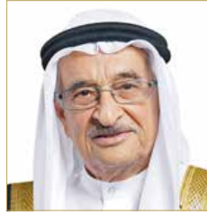
الشيخ محمد بن عبدالله

طبقاً للبند السابق، أن يحاول اجتيازه مجدداً مرتين إضافيتين شريطة حضوره دورة تدريبية لا تقل مدتها عن ستة أشهر في إحدى المؤسسات الصحية المعتمدة لدى الهيئة، وتقديمه ما يثبت اجتيازه لهذه الدورة التدريبية، وعلى أن تكون محاولة اجتيازه لامتحان التقييم في هاتين المرتين خلال سنتين من اجتيازه تلك الدورة التدريبية.