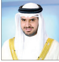
سمو الشيخ عيسى بن علي

والتعاوض الذي يسهم في تحقيق السلام والأمن والاستقرار على مستوى العالم. وأشار سموه إلى أن جائزة العمل التطوعي هي انعكاس واقعي لهذه الأخلاقيات البحرينية الأصيلة التي نتناقلها عبر الأجيال، وأن عنصر قوتها وتميزها يرتكز على تعدد أهدافها ومجالاتها وكذلك فئاتها. فتكريم رواد العمل التطوعي هو تكريم للعبء الإنساني المخلص، ووسيلة لتقديمهم كنماذج مضيئة يجب أن تحتذى من قبل الشباب.